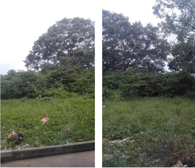
படம் 2: செயற்த்திட்ட அமைவிடத்தின் படங்கள்

750 புதிய வீட்டு அலகுகள் பேர்குஸன் பகுதியில் அமைக்க தீர்மானிக்கப்பட்டுள்ளது. தளவமைப்பு திட்டம் மதிப்பீடு மேற்கொள்ளப்பட்ட போது காணப்படவில்லை எனினும் இது வடிவமைப்பு மற்றும் நிர்மாண ஒப்பந்தக்காரரினால் விலைமனுக்கோரல் ஒப்பந்தம் கைச்சாத்திடப்பட்ட பின்னர் தயாரிக்கப்படும். ஒவ்வொரு தொடர்மாடி கட்டிடமும் தளமாடி மற்றும் 14 மாடிகளை கொண்டுள்ளன. தளமாடியில் முற்றம், கடைகள், சமூக மண்டபம், பராமரிப்பு அலுவலகம், முன்பள்ளி, சிறுவர் பராமரிப்பு நிலையங்கள், பொது மலசலகூடங்கள், பொலீஸ் காவல் நிலையம் மற்றும் ஒவ்வொரு தொகுதிக்குமான சுத்திகரிப்பு நடவடிக்கைகளுக்கான அறை மற்றும் தீயணைப்பு அறை ஆகியன காணப்படுகின்றன. ஒவ்வொரு அடுக்குமாடி கட்டிடத்திலும் விசேட சுகாதார பராமரிப்பு நிலையம் மற்றும் வாகன தரிப்பு இடங்கள் ஆகியன காணப்படுகின்றன. ஒவ்வொரு அடுக்குமாடி கட்டிடத்திலும் காணப்படும் ஒவ்வொரு வீடுகளினதும் ஆகக்குறைந்த தளப்பரப்பு 400 சதுர அடிகளாகும். ஒவ்வொரு வீட்டிலும் வாழறை, இரு படுக்கை அறைகள், சமையலறை, குளியலறை மற்றும் மலசலகூடம் (வெவ்வேறாக) மற்றும் மாடி முகப்பு