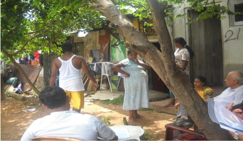
படம்2: அருணோதய மாவத்தையின் தற்போதைய நிலை

குறிப்பு: மீள்குடியேற்ற திட்டமிடல் பொறிமுறையின் பிரகாரம் சட்டரீதியான வாடகை ஒப்பந்தங்களை ஏற்படுத்துவோருக்கே வாடகை கொடுப்பனவு வழங்கப்பட வேண்டும். எனினும் நடைமுறையில் அத்தகைய ஒப்பந்தங்கள் குறைவு என்பதால் நகர அபிவிருத்தி அதிகாரசபை வாடகைக்கான கொடுப்பனவை மாத்திரம் வழங்கும். எனினும் இடம்பெயர்ந்த குடும்பங்களுக்கான புனருத்தாரண உதவி வழங்கப்படமாட்டாது. இதேவேளை இடம்பெயர்ந்த மக்கள் வியாபார நடவடிக்கைகளை குறித்த இடத்தில் மேற்கொண்டிருந்தால் உரிமைத்தகுதி வார்ப்படத்திற்கு அமைவாக வருமான இழப்பு உதவியை பெற்றுக்கொள்ள முடியும்.